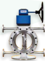
Cámara de calefacción